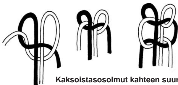
Kaksoistasosolmut kahteen suuntaan